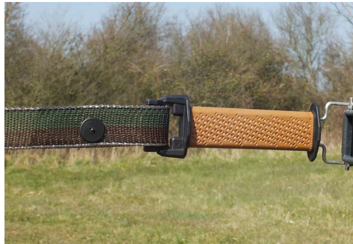
Poignée de porte ruban avec clip #RCLIPbl