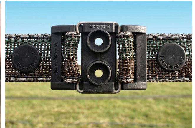
#BP34 avec #RCLIPbl