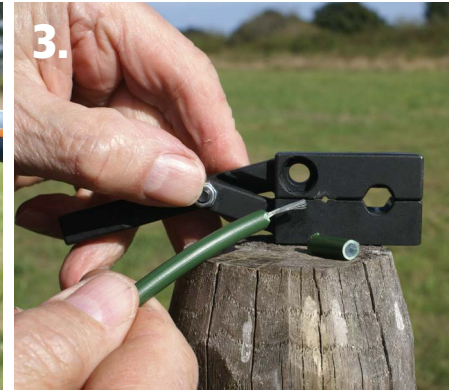
3. Sans ouvrir le sertisseur, tirer sur le câble pour le dénuder.