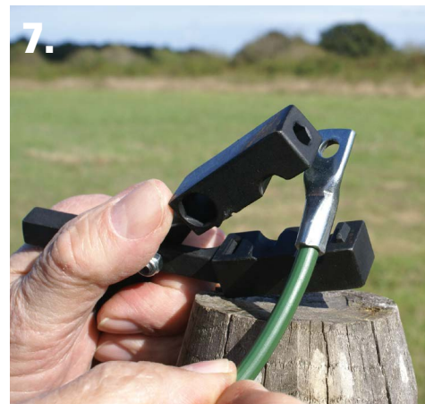
7. Et voilà vous avez réalisé ...