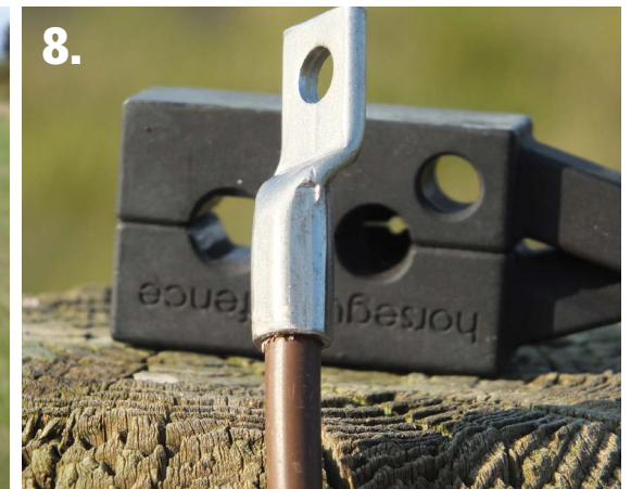
8. ...ce que les professionnels appellent un sertissage de pro.