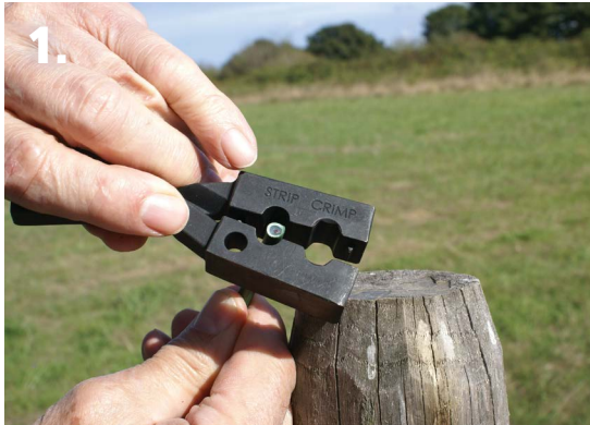
1. Placer le câble dans le trou « STRIP »