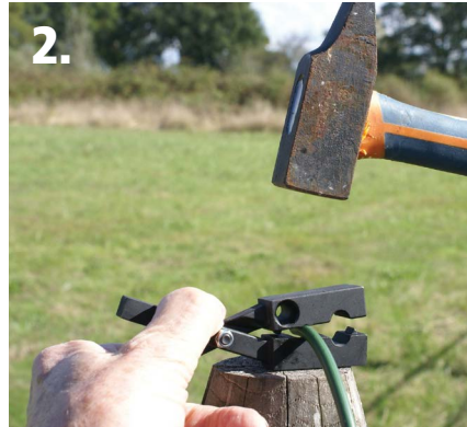
2. Frapper un ou deux coups de marteau.