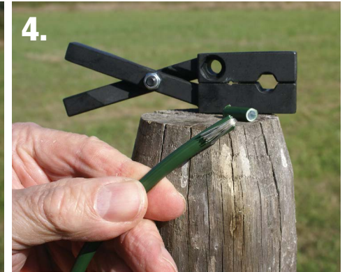
4. Pousser les fils métalliques le long du câble et enfoncer le tout dans la cosse.