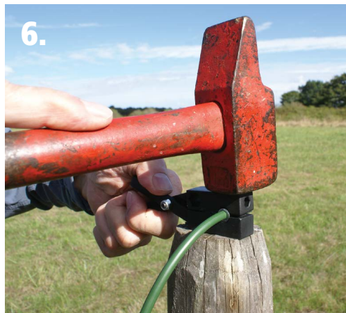
6. Et frapper 5 ou 6 violents coups de marteau jusqu'à ce que les 2 mâchoires se touchent.